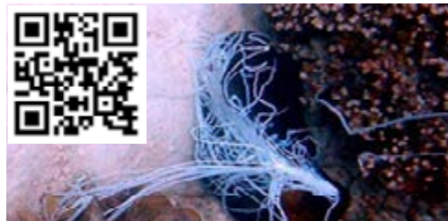
Brániaca sa holotúria

S obrannými systémami holotúrií si neporadí len tak hociký predátor. Toxín holoturín je pre mnohých z nich smrteľný. Niektoré druhy pri pocite nebezpečenstva silným stlačením tela vyvrhnú análnym otvorom vlastné lepkavé črevá a zmes ďalších vnútorností. Predátor sa do nich následne zamotá a môže byť na chvíľu oslepený. Holotúria môže utiecť a behom pár týždňov zregenerovať stratené orgány. Holotúrie navyše nemajú nič pripomínajúce kostru. Svoje telo dokážu premeniť na "šmykľavý sáčok plný kvapaliny", doslova pretiecť pomedzi skaly a ujsť predátorovi nadobro.