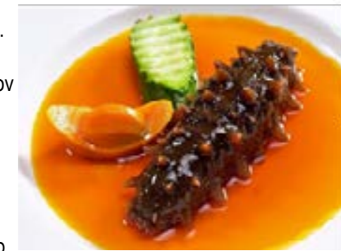
Holotúria na zjedenie