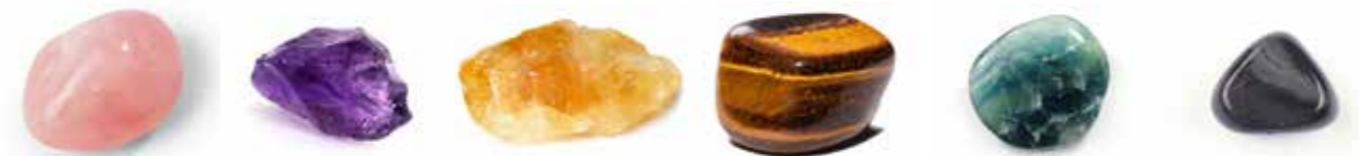
zľava: ruženín, ametyst, citrín, tigrie oko, fluorit, obsidián